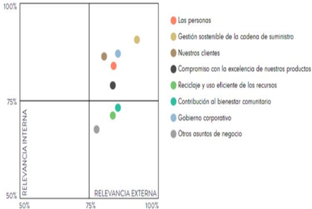
MATRIZ DE MATERIALIDAD AGRUPADA POR PRIORIDADES