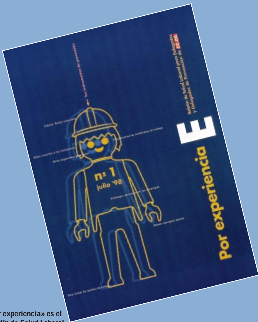
«Por experiencia» es el Boletín de Salud Laboral para todos los delegados y delegadas de Prevención de Comisiones Obreras