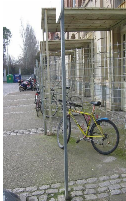
P bicis actual