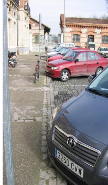
P bicis idóneo en exterior