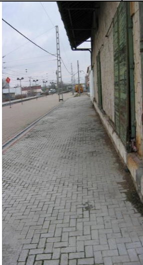
P bicis andén norte