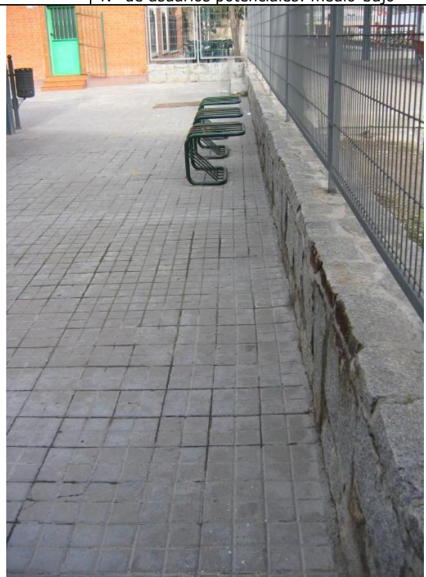
espacio apto para P exterior