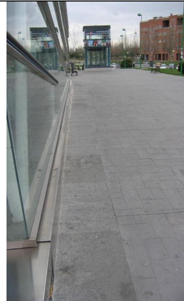
P idóneo lateral isleta