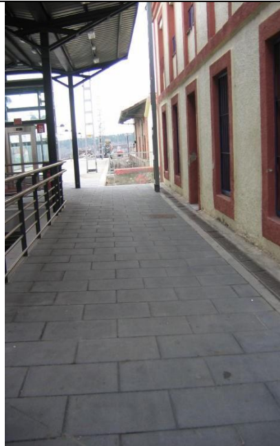
P bicis lateral sur andén