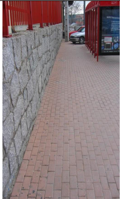
P exterior parada buses