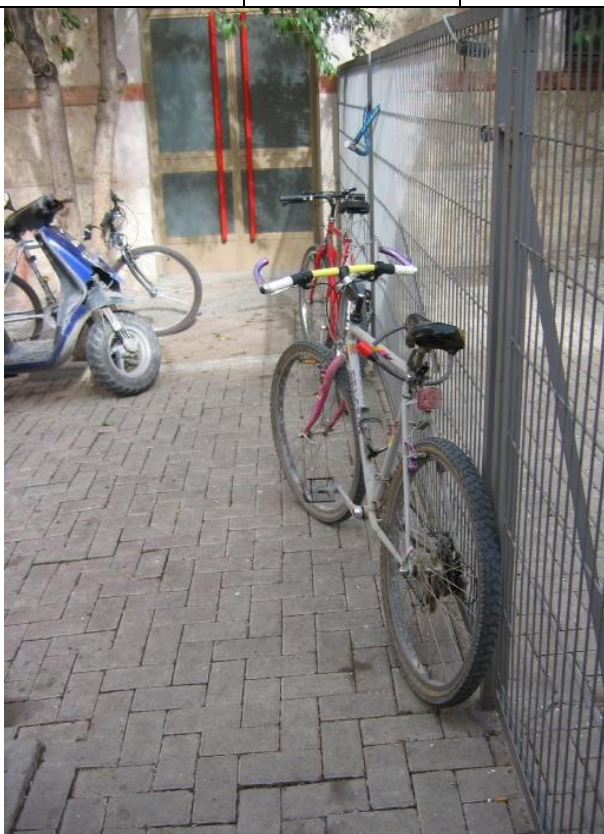
acera exterior apta para P bicis