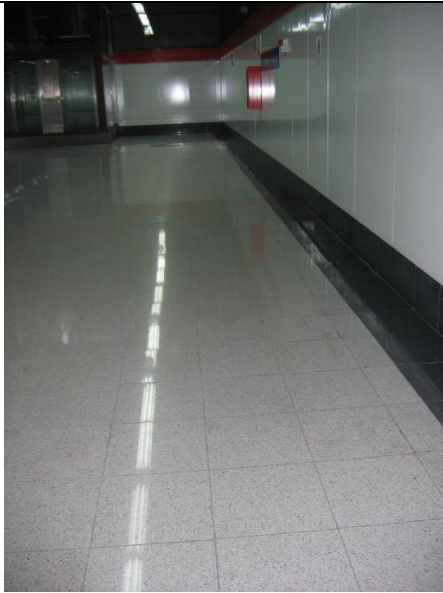
P idóneo vestíbulo Cercanías