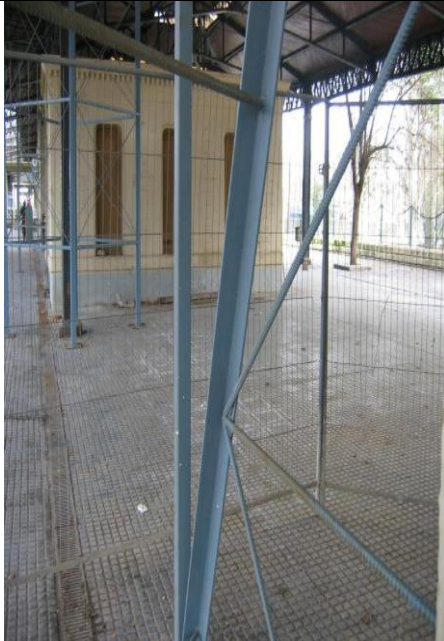
P bicis interior bajo marquesina