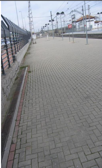
P bicis lateral norte andén