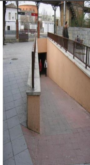
P bicis exterior