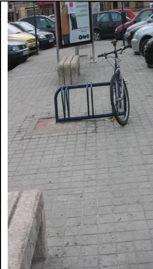
P bicis actual