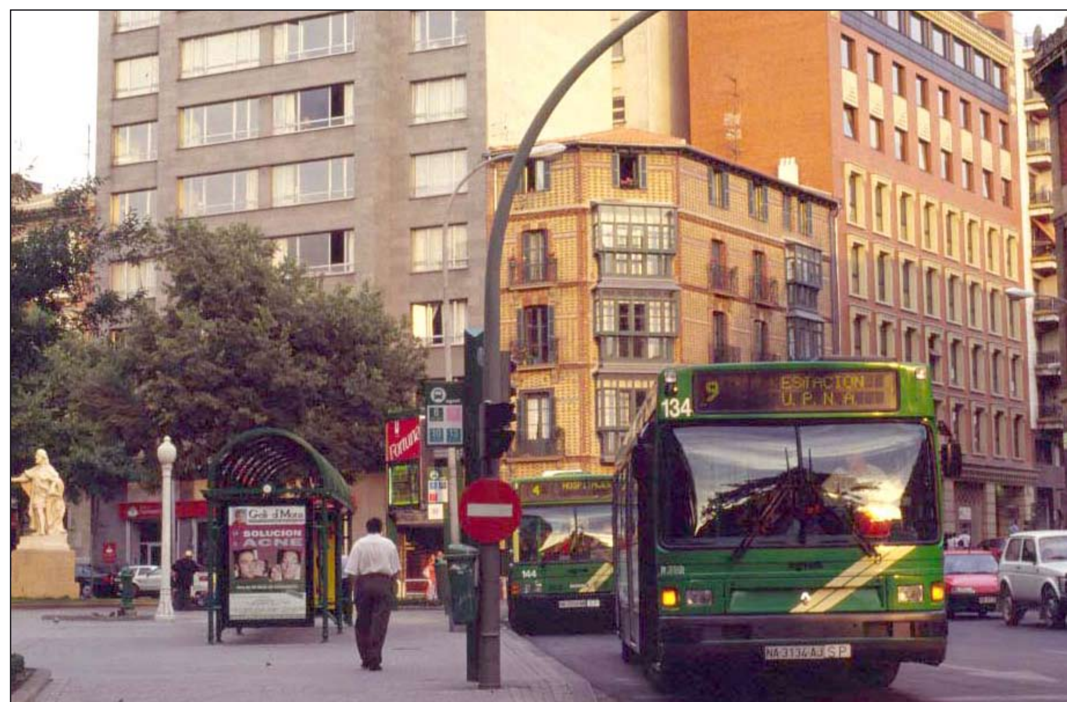
Autora: Pilar Vega