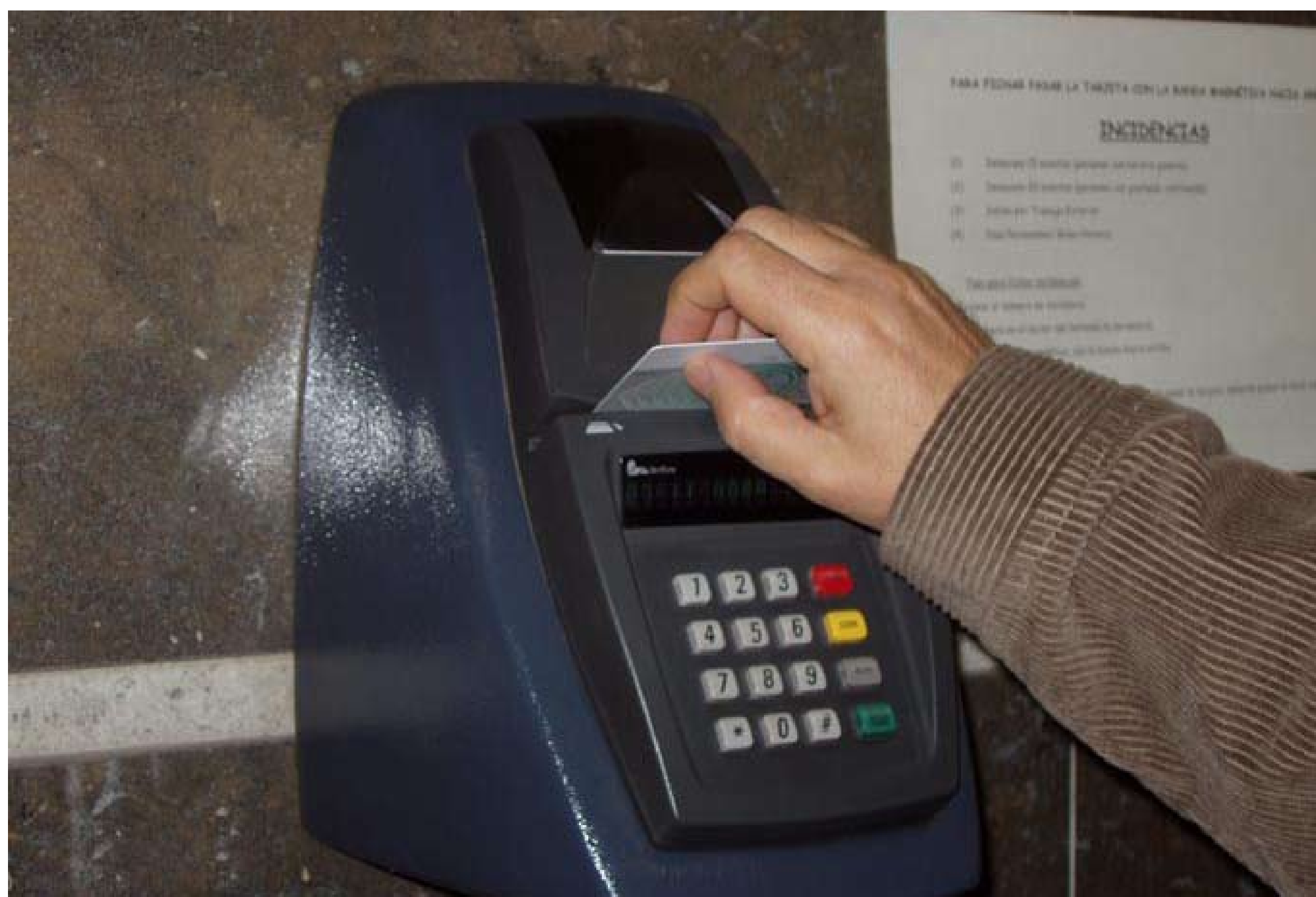
Autora: Pilar Vega

El tiempo destinado al transporte al trabajo es un tiempo que se detrae del descanso de las personas. El aumento de las distancias entre residencia y trabajo ha prolongado la jornada laboral de la mayoría de la población, superándose los horarios contratados y de convenio. Tiempo de transporte que hay que añadir al tiempo de trabajo.