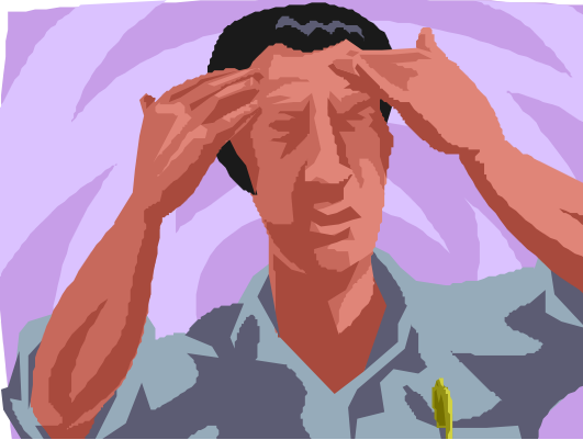
Cuadro 7: Ejemplos de acciones para prevenir el estrés laboral