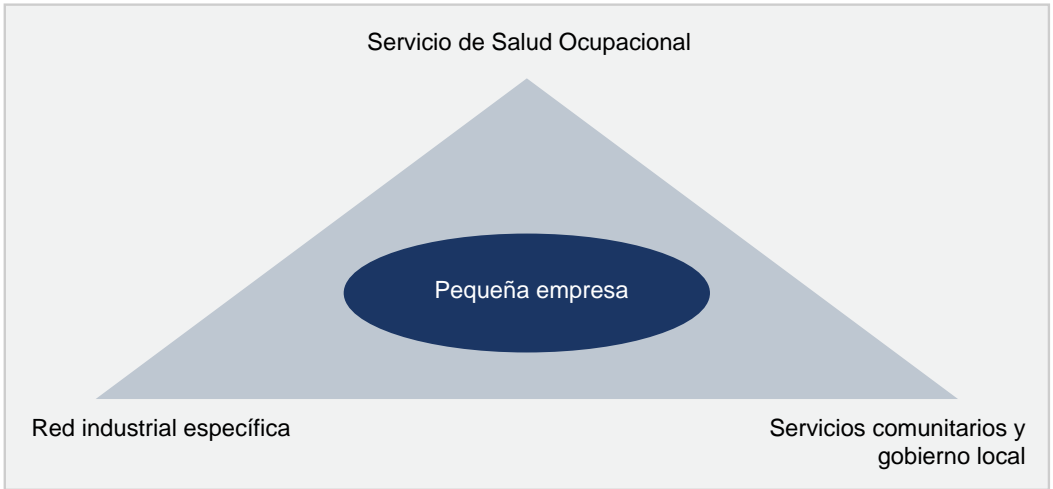
Figura 3 Red de apoyo para pequeñas y medianas empresas (OMS, 1999)

El trabajo en redes provee varios beneficios potenciales que incluyen: