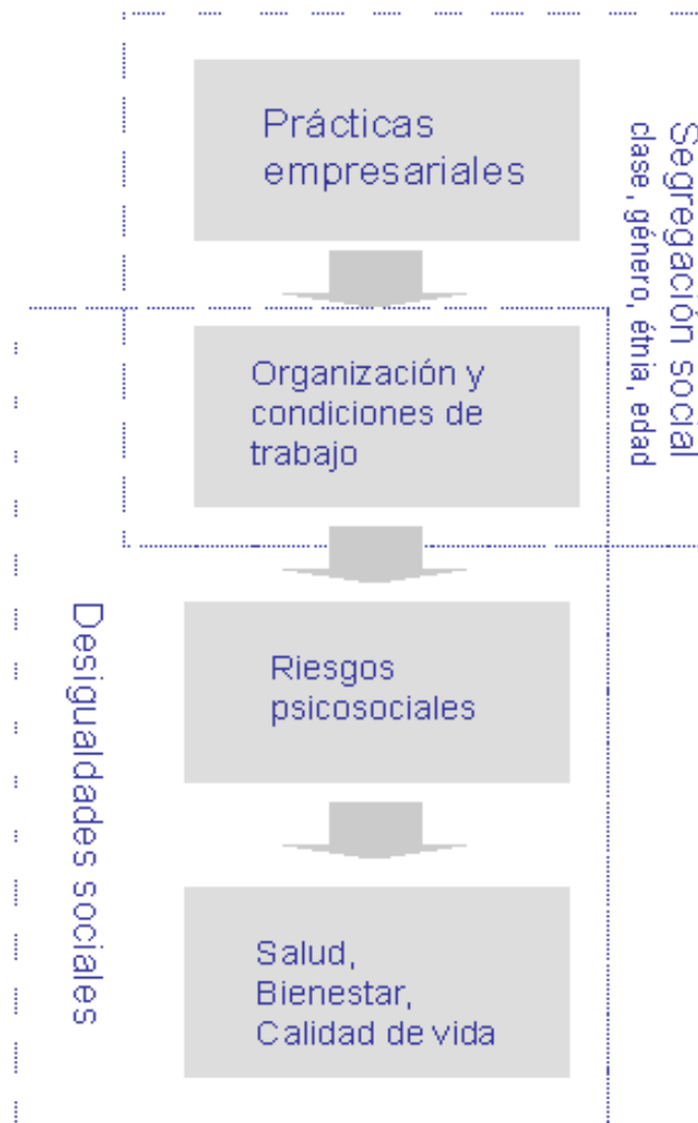
Figura 1.- Prácticas empresariales y desigualdades sociales