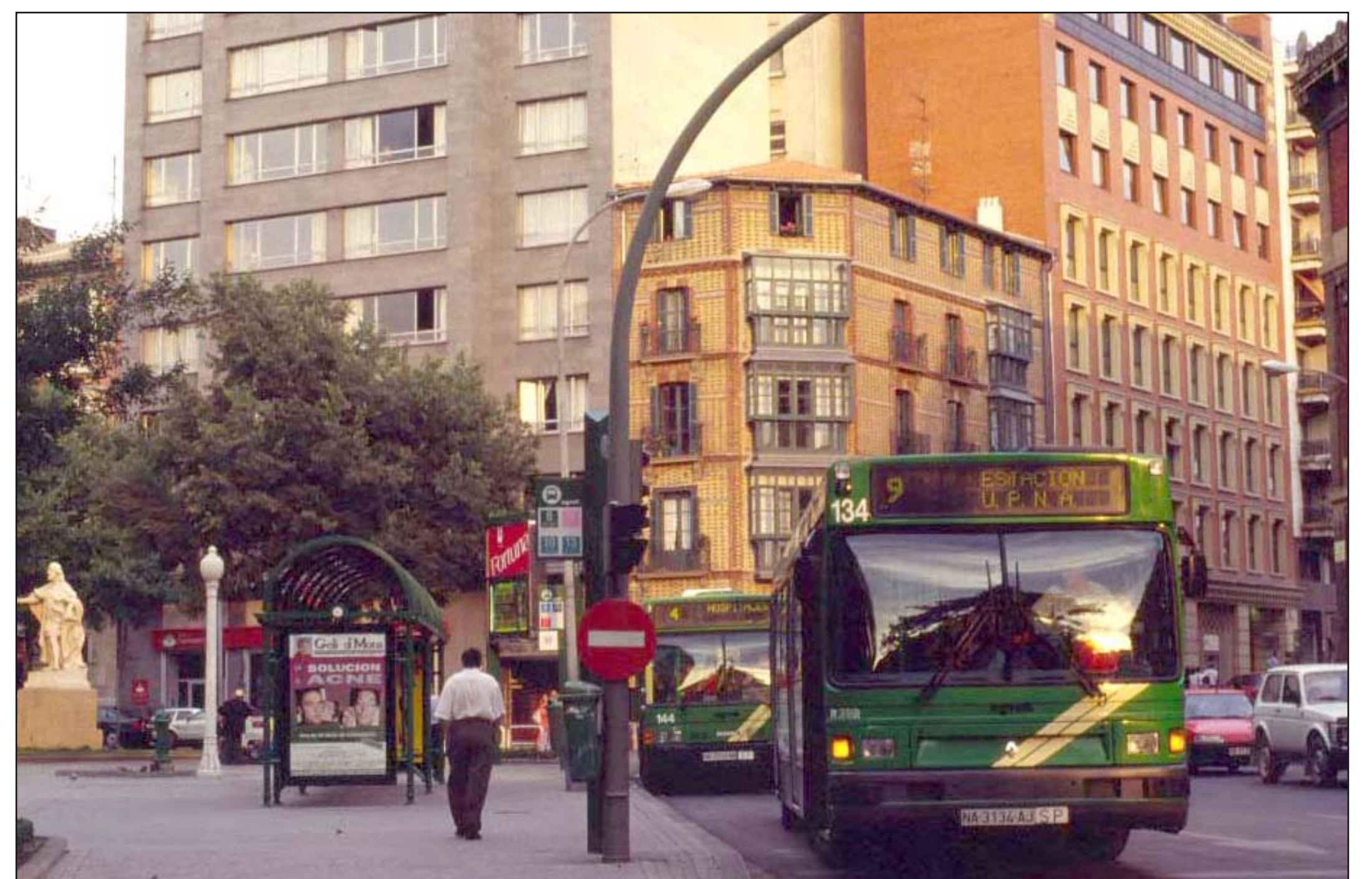
Autora: Pilar Vega