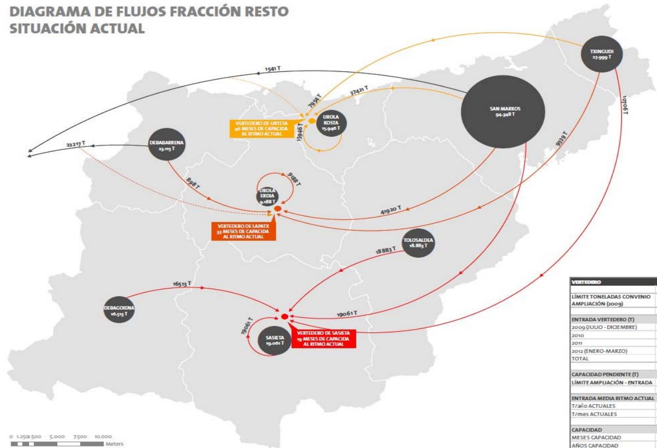
DIAGRAMA DE FLUJOS FRACCIÓN RESTO SITUACIÓN ACTUAL